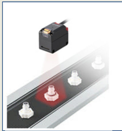
KEYENCE製「面光電センサ」AIシリーズ