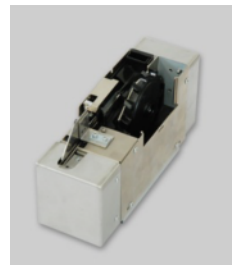
〔 NJN-ZE 〕