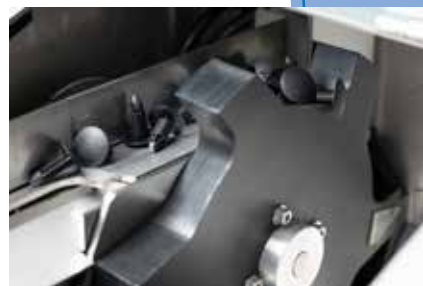
回転ドラムによる汲み上げ方式